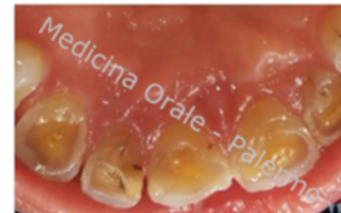
BRUXISMO (clicca qui per una breve