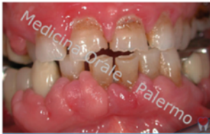
AUMENTO DI VOLUME GENGIVALE (clicca qui per una breve